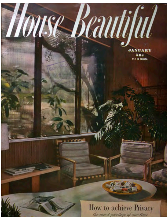
Abb. 6: House Beautiful , Januar 1950 (Cover)