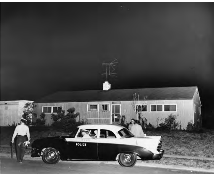
Abb. 10: Polizeistreife vor dem Haus der Myers am 14. August 1957

die vor dem Haus der Myers und dem der Wechslers Nacht für Nacht Wache stand. 141