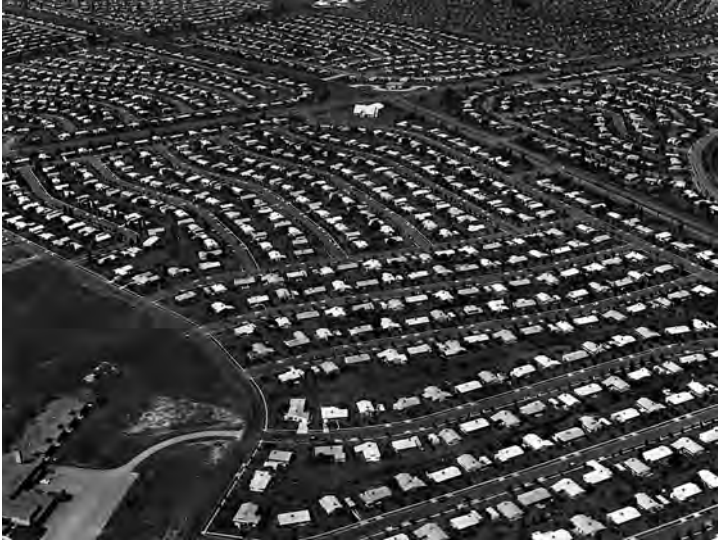
Abb. 3: Luftaufnahme von Levittown, Pennsylvania, um 1959