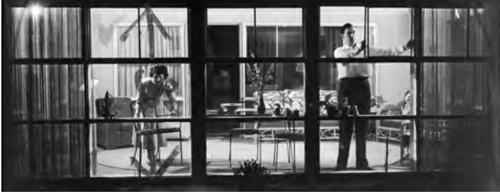
Abb. 4 Blick durch ein Panoramafenster

nen aus Soziologie, Architektur und Design. Auf das massenproduzierte Panoramafenster ließen sich eine Bandbreite von sozialen und politischen Konflikten projizieren, es wurde gar, so Isenstadt, »demonized as emblematic of pretty much everything wrong in architecture, America, or both.« 92 Zunehmend negative Bewertungen verbanden mit den massenproduzierten Panoramafenstern und deren Besitzer:innen konsumistische, vom Wunsch nach Status und Anerkennung getriebene, oberflächliche Sensibilitäten. 1961 schrieb Daniel Boorstin in einem Kapitel mit dem Titel »From the American Dream to American Illusions? The Self-Deceiving Magic of Prestige« über das suburbane Panoramafenster: