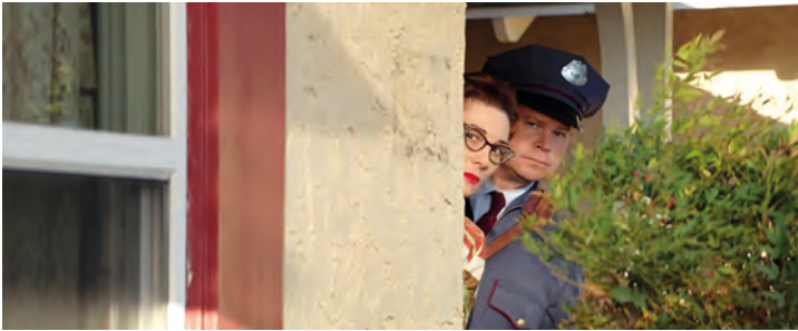
Abb. 2: SUBURBICON, USA, 2017

Devianz und Andersartigkeit, die im Klima des Kalten Kriegs vorherrschten, bestimmt. Im Kontext dieser Suburbanisierung tritt Privatheit als zentrales Anliegen der Vorstadtbewohner:innen