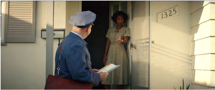
Abb. 1: SUBURBICON, USA, 2017